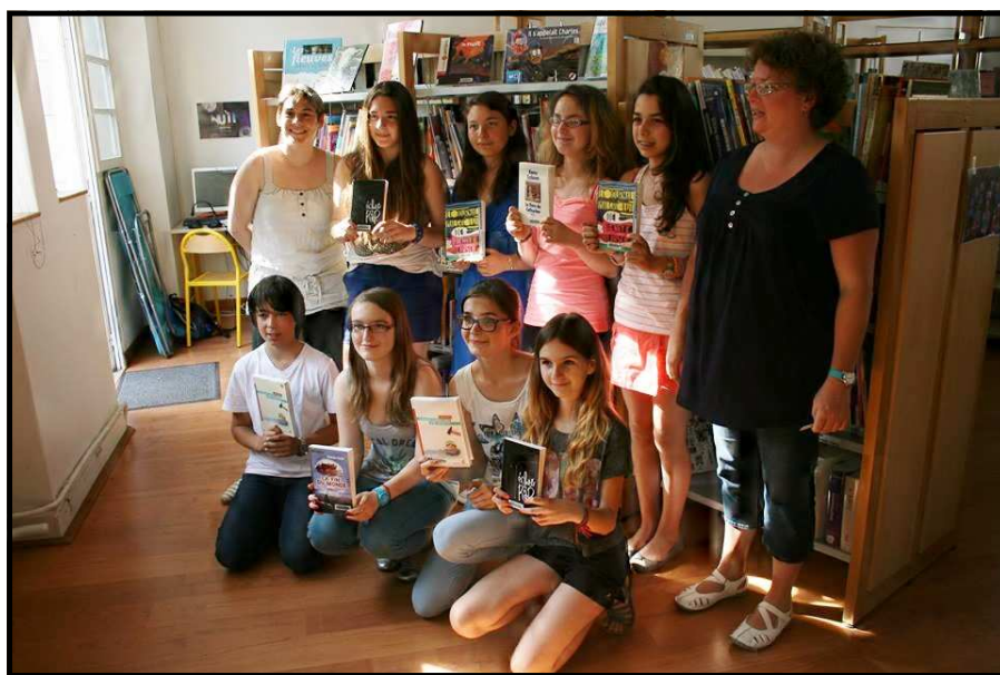
Prix « Histoires d'ados » 2014